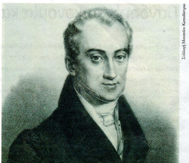
Ιωάννης Καποδίστριας. Δωρεά Αναγνωστικής Εταιρείας Κερκύρας.

Πριν από λίγους μήνες, τον Σεπτέμβριο του 2021, ο συγγραφέας Παναγιώτης Πασπαλιάρης εξέδωσε το παρουσιαζόμενο βιβλίο, που περιέχει ένα εισαγωγικό κείμενο (σελ. 9-130), όπου καταθέτει την προσπάθειά του για την ταύτιση του Ανώνυμου συγγραφέα. Ο Πασπαλιάρης παραθέτει τεκμήρια υποστηρίζοντας ότι ο συγγραφέας της Ελληνικής Νομαρχίας θα μπορούσε να είναι ο Ιωάννης Καποδίστριας. Στη συνέχεια δημοσιεύει το κείμενο της Ελληνικής Νομαρχίας του 1806 «με τα ορθογραφικά της σφάλματα» (σελ. 139-286).