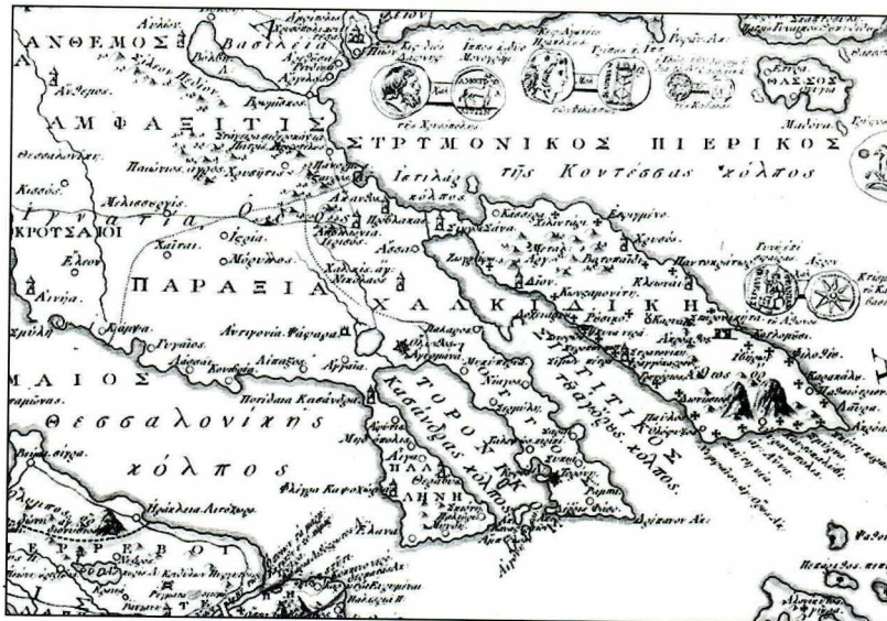
Η Χαλκιδική στον χάρτη της αρχαίας Ελλάδος του Delisle πάνω και στην «Χάρτα της Ελλάδος» κάτω με την ταυτόσημη μορφολογία.