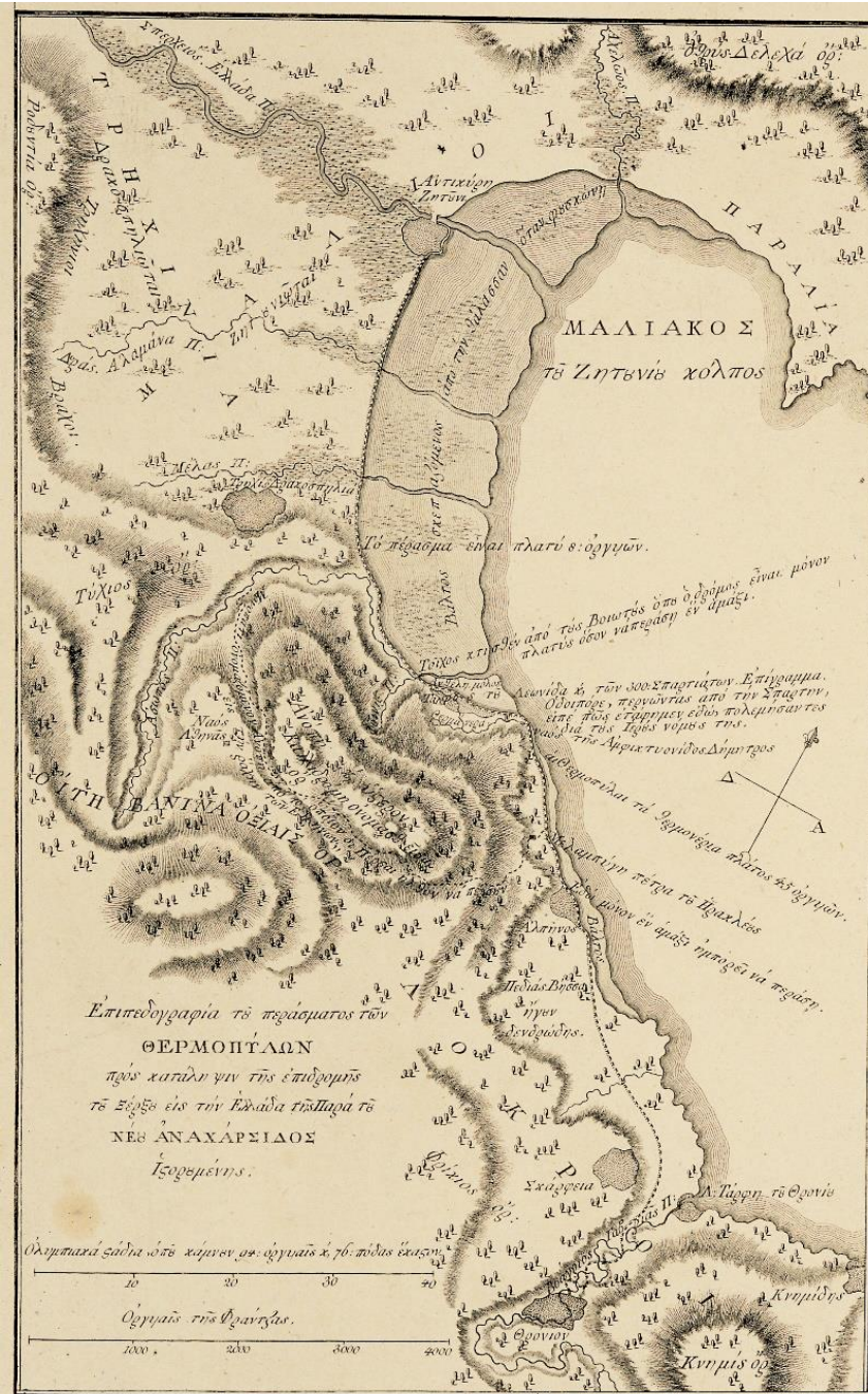
Η Επιπεδογραφία του «Περάσματος των Θερμοπυλών» από το 2 ο φύλλο της Χάρτας του Ρήγα.