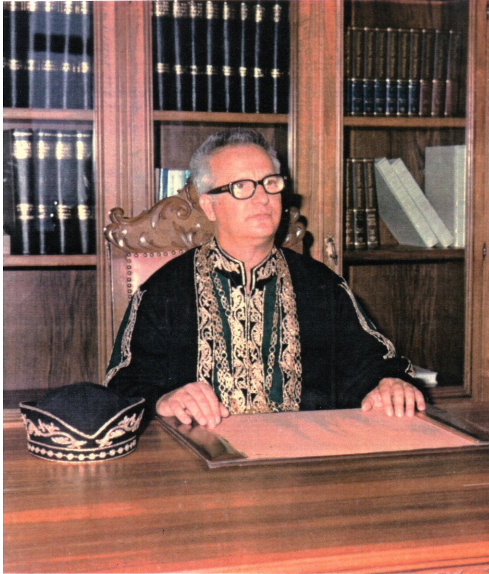
Ο Καθηγητής Αθαν.Γ.Πανάγος το 1977, ως Πρύτανης του Πανεπιστημίου Πατρών