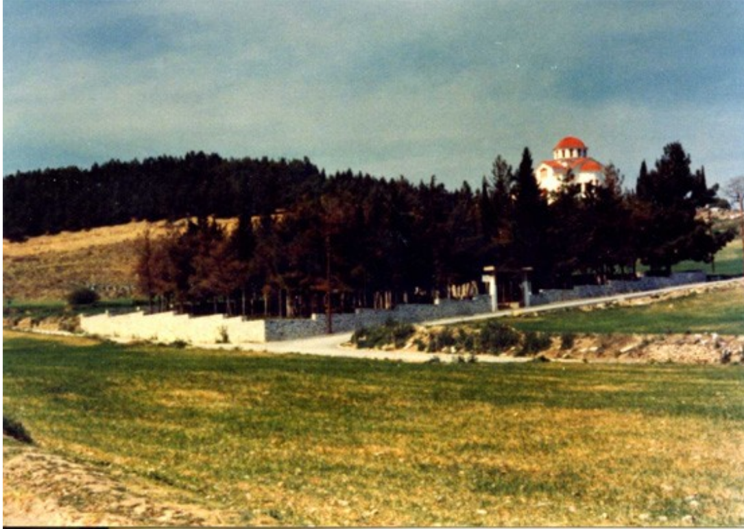
Ο δενδροφυτεμένος χώρος ΣΠΙΤΙ ΤΟΥ ΡΗΓΑ κατά το 1975, όπου είχε στηθεί το πρώτο Μνημείο μετά το 1900, όπως διακρίνεται στην επόμενη φωτογραφία.